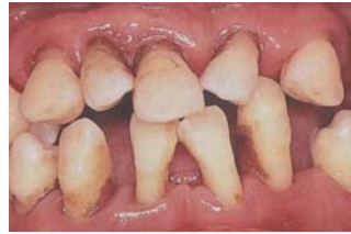
歯周病で歯がぐらついた状態