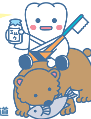
ご当地よ坊さん 北海道