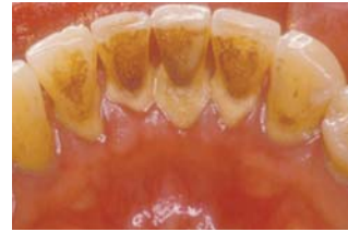
歯石が多く付着した歯の裏側の状態